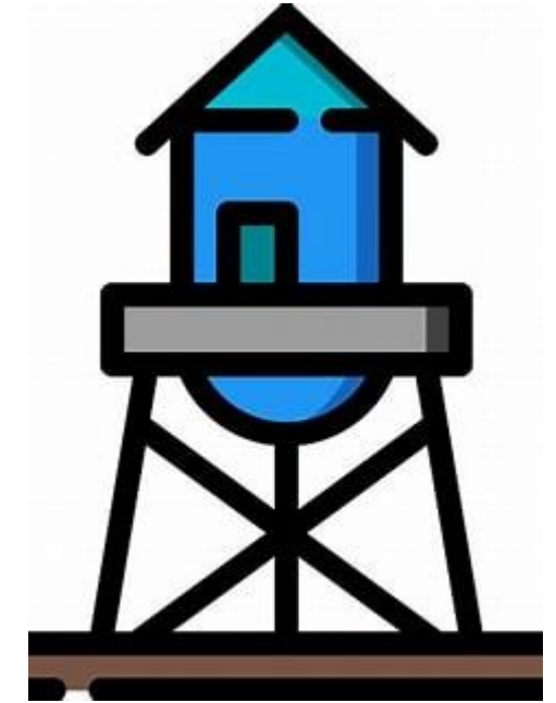
Uniquement le renforcement des systèmes