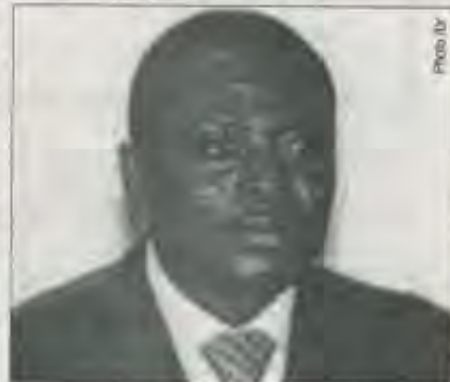
Raphaël Edou, ministre de la Santé par intérim

afin d'assurer un assainissement durable aux populations rurales, surtout les plus vulnérables. Selon les derniers indicateurs publiés par le Joint Monitoring Programme (JMP), dans la région de l'Afrique de l'Ouest, 73% de la population n'a pas accès aux ouvrages améliorés d'assainissement, et 25% pratiquent encore la défécation à l'air libre. Au Bénin, ces proportions sont respectivement de 26% pour le nonaccès aux ouvrages améliorés d'assainissement, et de 54% pour la défécation à l'air libre, selon les mêmes sources. En somme, des statistiques qui témoignent de l'urgence à agir et de l'opportunité de cet atelier.